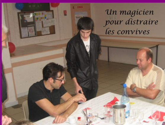
Un magicien pour distraire les convives