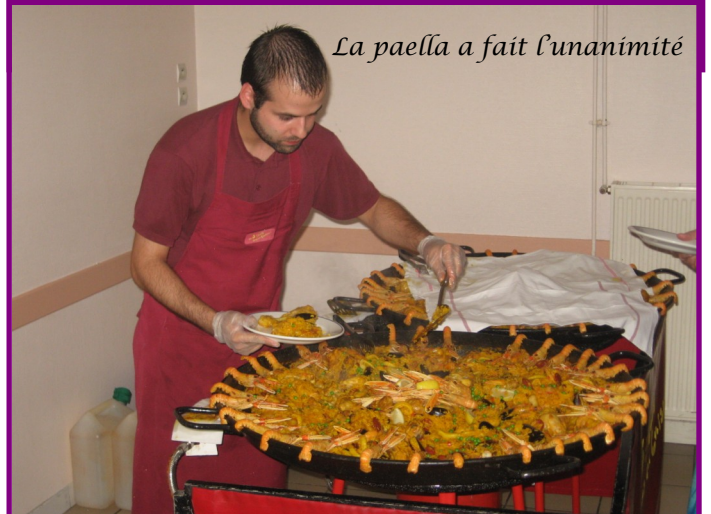
La paella a fait l'unanimité