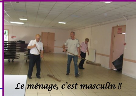
Le ménage, c'est masculin !!