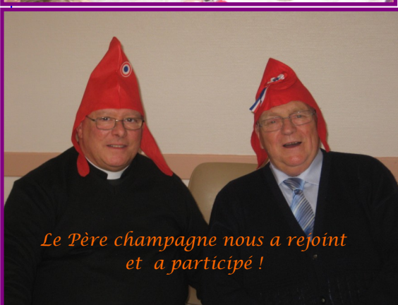
Le Père champagne nous a rejoint et a participé !