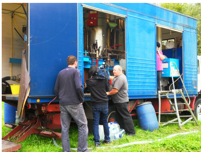
L'équipe de TF1 en tournage

A l'heure où paraît ce Cinquex Info, certains auront sans doute déjà vu ce reportage : toutefois, si vous l'avez manqué, vous pouvez le revoir sur ce site : www.tf1.fr/jt-13h/ . Il reste en ligne environ 2 mois.