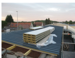
Rénovation du groupe scolaire